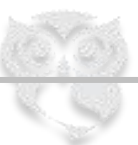
Tabla CCA: Principales características de los instrumentos de capital regulador y otros instrumentos admisibles como TLAC- no aplica

APR: Activos ponderados por Riesgo, definido por el importe resultante de multiplicar por 12.5 la exigencia de capital mínimo total (por riesgo de crédito, por riesgo de mercado y por riesgo operacional)